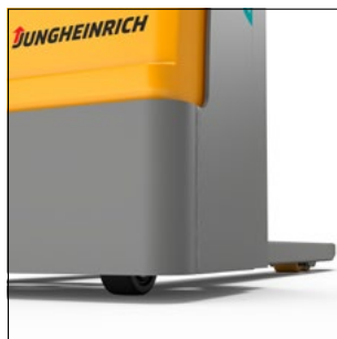
Sécurité élevée grâce à une faible garde au sol