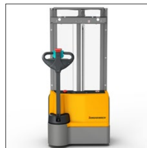
Visibilité à travers le mât optimisée