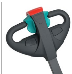
Tête de timon ergonomique