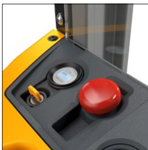
Disposition centrale des instruments de contrôle